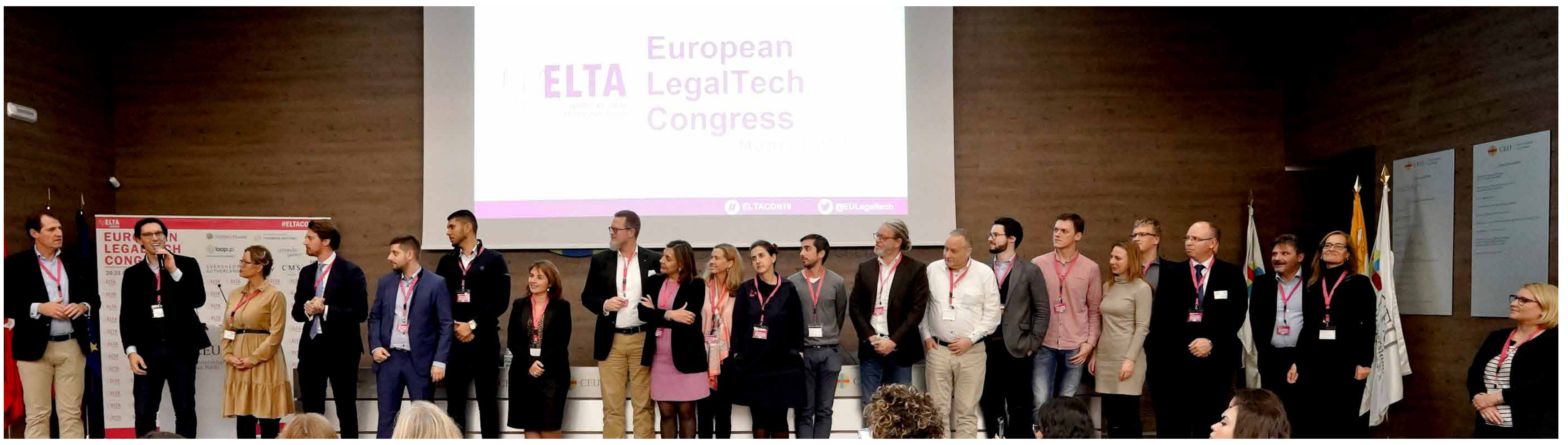
Representantes de ELTA